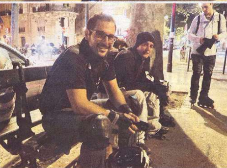
Tour Montparnasse (Paris), vendredi soir. Un peu plus de 200 personnes ont pris le départ sur un parcours de 22,4 km.