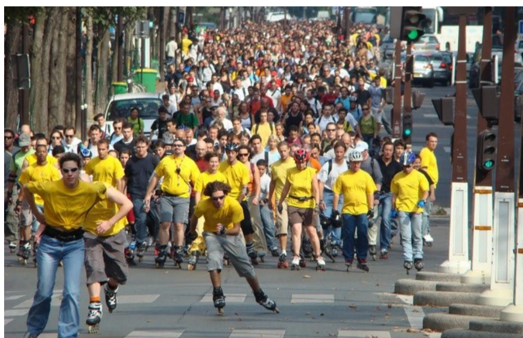
La randonnée roller du dimanche réunit des milliers de participants - «Rollers & Coquillages»